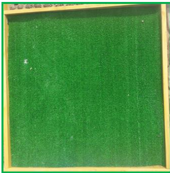
Мягкая искусственная трава